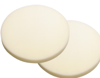
3M™ ポリッシングスポンジ 5734

*上記推奨使用方法は代表的な例です。磨き作業では前後の工程や各種条件により、最適な工程や資材の組合せには様々な選択肢がございます。詳しくは当社営業へ是非ご相談ください。