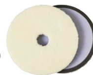
3M™ ウールバフ QT 5756