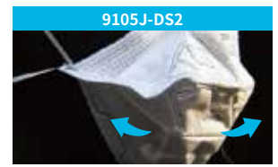
煙はマスクのフィルター部分を通過