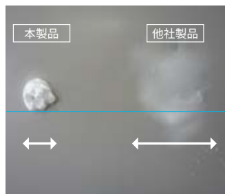
噴射時の周囲への飛び散りが少ない