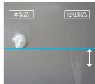
噴射後の液だれが少ない