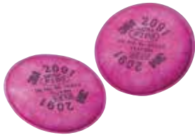
3M™ ろ過材 2091