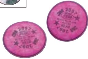
3M™ ろ過材 2097

3M独自の帯電フィルターは、オイルミストがある環境下でも長時間・安心してご使用いただけます。フィルター両面から空気を取り込めるラウンドフィルターデザインを採用し、呼吸が楽におこなえます。溶接スパッタや液滴からろ過材を保護する専用カバー [別売 (予定)] をご用意しています。