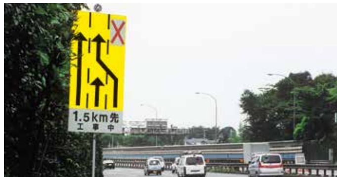
前方工事中看板設置例