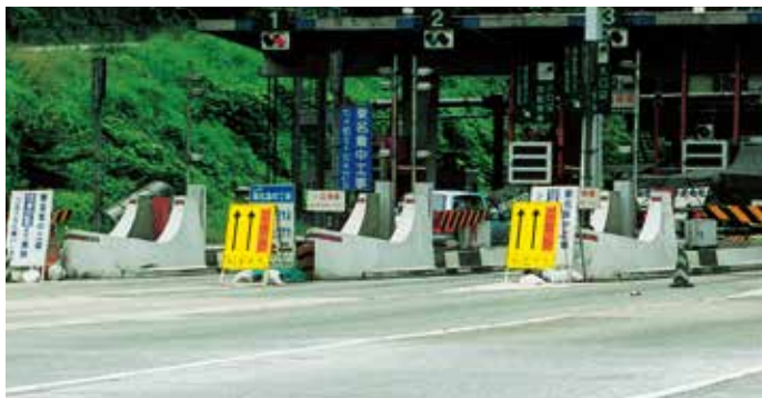
料金所附近設置例