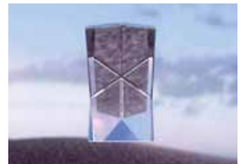
フルキューブ(写真はイメージです。)

従来の広角プリズム型反射シートは、三面体キューブを使用していましたが、一部は反射をしていませんでした。ダイヤモンドグレード™ 反射シートは、フルキューブとしているため、ほぼ100%の反射面をもつ反射シートを実現しました。