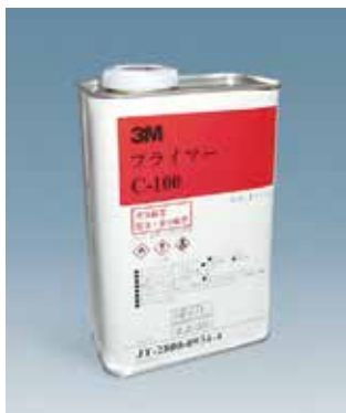
【推奨プライマー】 3M™ プライマー C-100