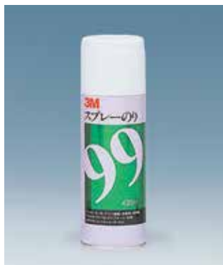
【推奨プライマー】 3M™ スプレーのり99