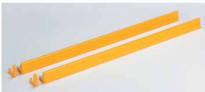
表側（蛍光反射材付き）