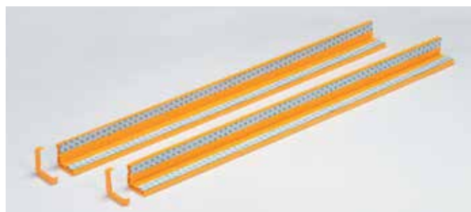
裏側（強力両面接合材付き）