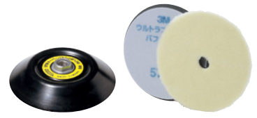
3M™ テーパーバフパッド 5718