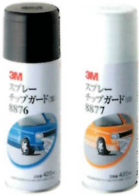
3M™ スプレーチップガード(黒) 8876