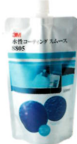
3M™ 水性コーティング スムース 8805