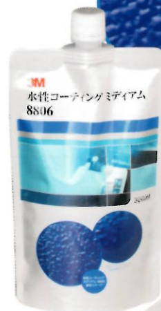
3M™ 水性コーティング ミディアム 8806