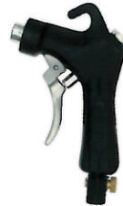
ノンクリーンアップ ガン 8801