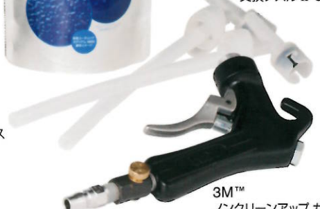
3M™ ノンクリーンアップ ガン 8801