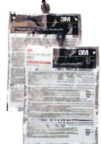
3M™ ウレタンコーティング 8822/8823