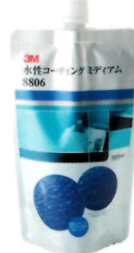
3M™ 水性コーティング ミディアム 8806