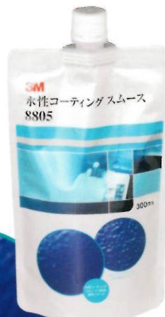
3M™ 水性コーティング スムース 8805