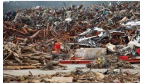
ゴミ処理・がれき撤去作業