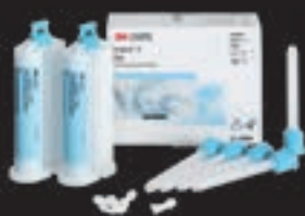
Imprint™ 4 Bite refill (71529)