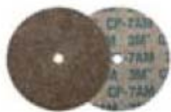
CP-UW Diam. 76 mm