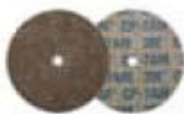
CP-UW Diam. 51 mm