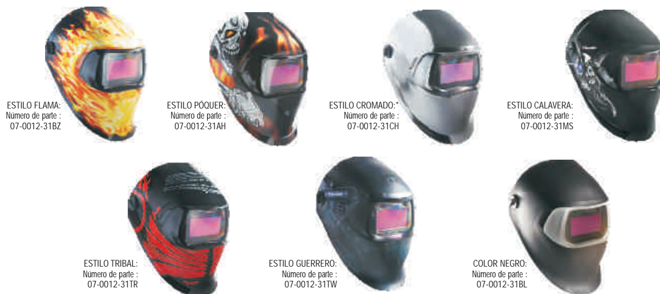
ESTILO FLAMA: Número de parte : 07-0012-31BZ

Estos siete modelos nuevos están disponibles con el lente Speedglas 100V, que cuenta con cinco opciones de sombra, desde la sombra 8 hasta la sombra 12, y una sombra clara de 3. Este lente tiene tres niveles de sensibilidad: un nivel normal usado para la mayoría de los tipos de soldadura, en interiores y exteriores; un nivel para situaciones donde hay otros soldadores trabajando en un área cercana; y un nivel de corriente bajo o arco estable de soldadura.