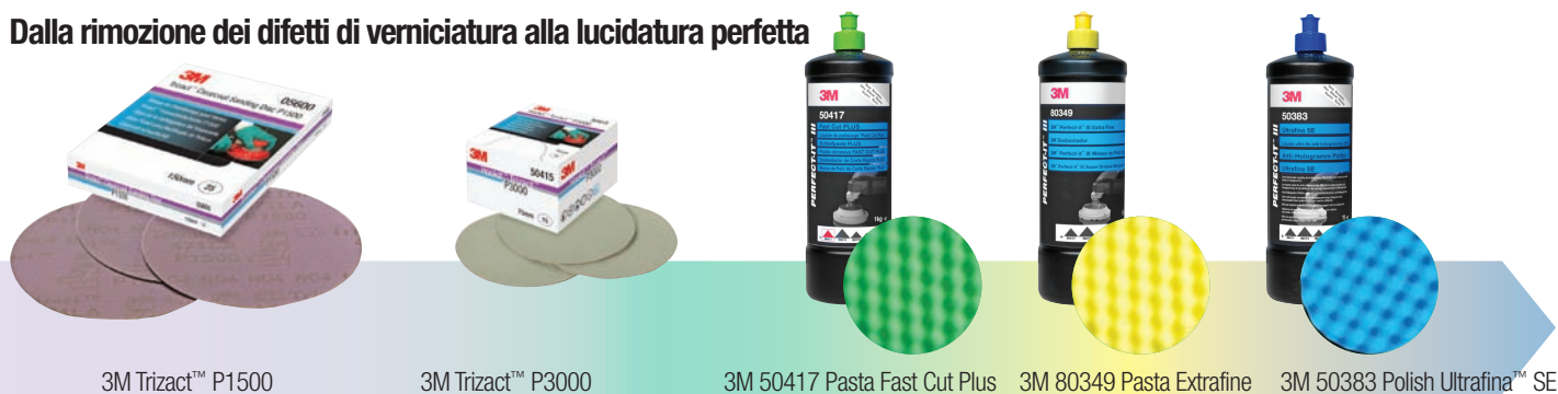
3M Trizact™ P1500