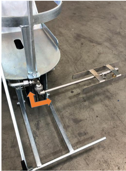
Anschrauben des Sprüharms