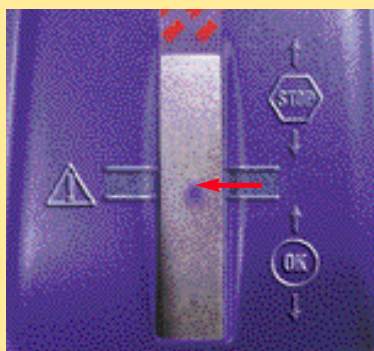
Se recomienda cambiar el aceite