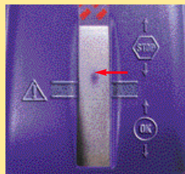
Desechar el aceite