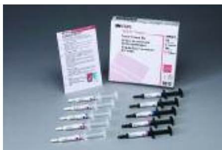
Paquete Familiar Resina RelyX™: 7612