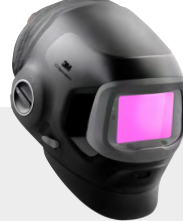
G5-03 Pro Air