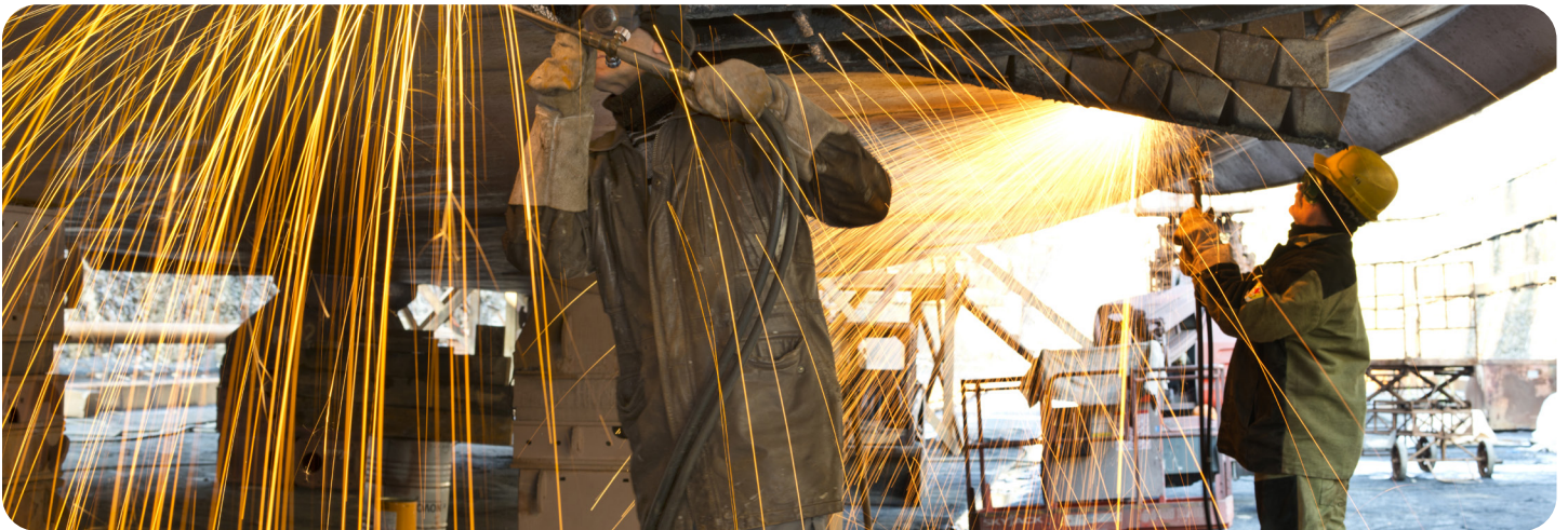
ผู้ปฏิบัติงานกำลังเชื่อมรอยต่อบนตัวเรือในขณะที่เรืออยู่ในอู่แห้ง