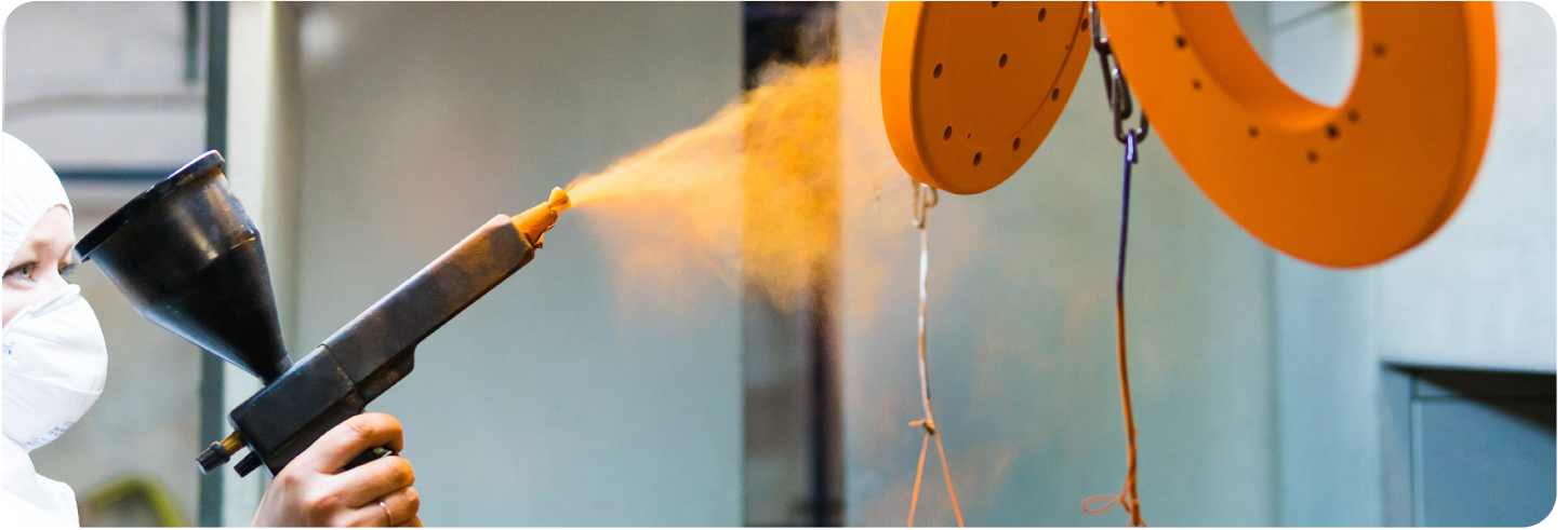
3M™ Polyester Tape เทปโพลีเอสเตอร์ รุ่น 8992 ใช้สำหรับปิดบังบางพื้นที่จากสีในระหว่างกระบวนการเคลือบด้วยสีฝุ่น