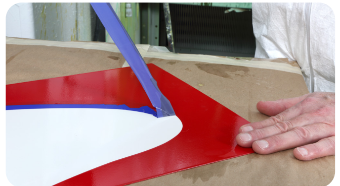
3M™ Vinyl Tape เทปไวน์ล รุ่น 471+ ช่วยต้านทานขอบเผย แม้ในส่วนโค้งที่มีความแคบเพื่อช่วยให้เส้นสีดูคมชัด