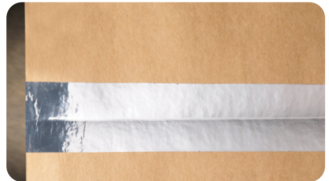
3M™ 폴리에스터 테이프 850 실버는 자동화된 기계가 금속 탐지를 통해 접합부를 찾아내는 접합 용도로 사용됩니다.