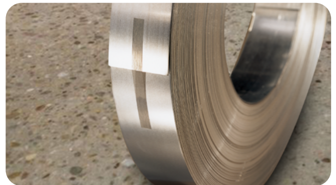
금속에 기름기가 있는 경우에도, Scotch® 필라멘트 테이프 898MSR의 접착제는 세척 없이 부착되도록 설계되었습니다.