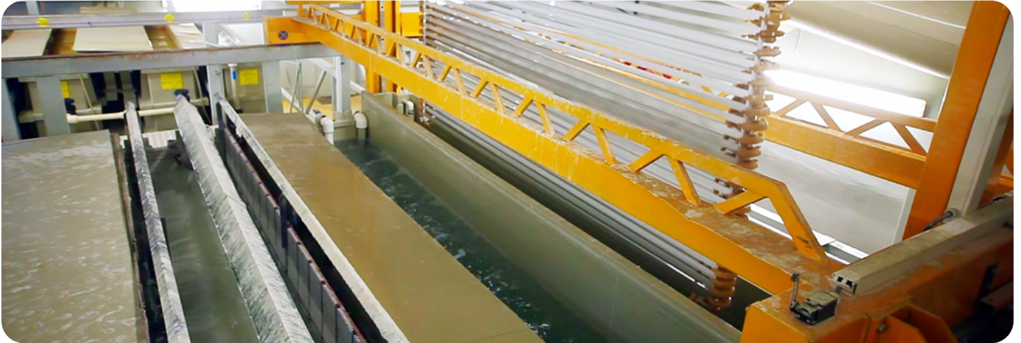
금속 부품은 일반적으로 랙에 놓은 다음 수동으로 또는 그림과 같이 자동으로 산성 배스에 담급니다.