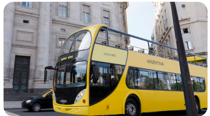
끊임없는 승객의 마모, 자외선, 심지어 공해까지도 버스 표면을 손상시켜 최상의 외관을 보이지 못할 수 있습니다.