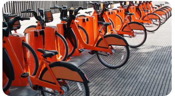
전기자전거는 대부분 야외에 보관하므로 악천후에 더 많이 노출됩니다.