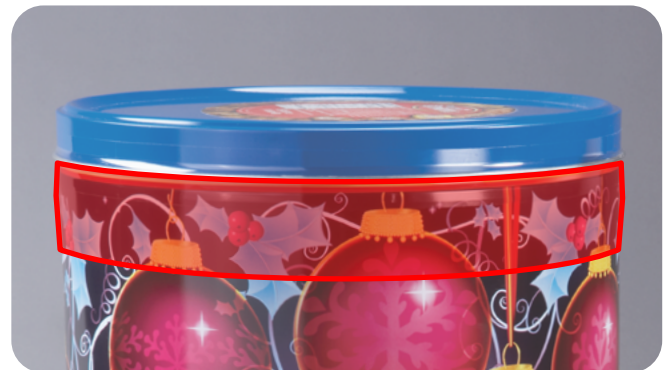
3M™ 비닐 테이프 471은 깔끔한 제거가 중요한 식품 및 선물용 통을 밀봉하는 데 사용할 수 있습니다.