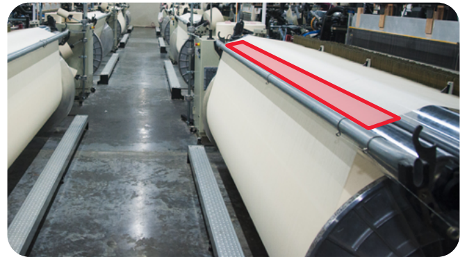
제조 공정을 거칠 때 테이프 스플라이스를 나타내는 윤곽선입니다.

아스팔트 싱글 및 지붕 자재 제조에 일반적으로 사용되는 유리섬유 매트 웹의 버트 접합은 물론 카펫과 같은 고강도 직물 제조에도 사용됩니다. 3M™ 열경화성 유리섬유 테이프 365 또는 3650 테이프를 두 개의 양끝 끝부분 위에 손으로 붙입니다. 그런 다음 다리미로 열을 가합니다. 백킹이 굳을 때까지(연한 황갈색이 될 때까지) 다림질한 후, 축압기와 처리를 거쳐 다리미를 땁니다.