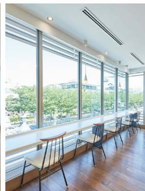
お店は若宮大路沿いの二の鳥居前にある。春には桜並木を楽しむことができるが、ブラインドを下げると見えなくなってしまう。