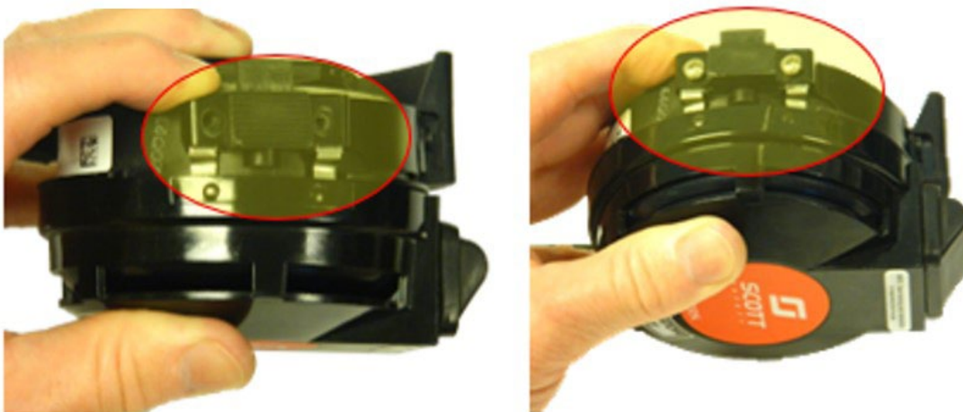
Figure 1: Cover Screen Location/Screws Missing versus Cover Screws Installed

If you identify one or more units within the date range of this notice, please visually inspect them to ensure the presence of the mounting screws as shown . If after inspection, it is discovered that an MMR is missing the mounting latch screws, take the MMR out of service and contact your 3M Scott Fire & Safety Authorized Service Center to complete the repairs required. Please note that it is unlikely a fielded SCBA, having been placed in service and previously inspected, would have missing screws.