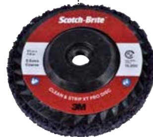
DISCOS SCOTCH-BRITE™ CLEAN AND STRIP XT PRO.