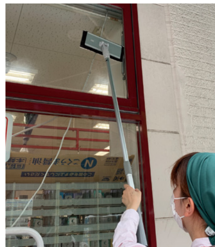
窓ガラスの清掃も、軽量ツールと 使い捨てモップで手を濡らさず簡単に