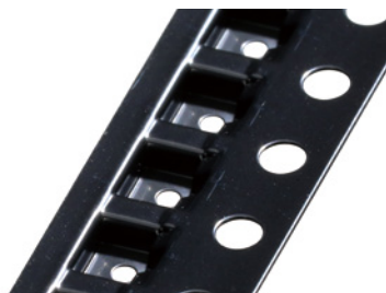
一般的な3M™ 導電エンボスキャリアテープ No. 3000

規制について: 本製品に関する規制情報については、3Mの担当者にお問い合わせください。