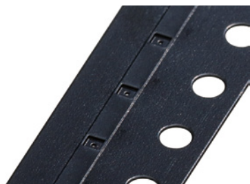
レイズドプラットフォーム形状 3M™ 導電エンボスキャリアテープ No.3000XPR