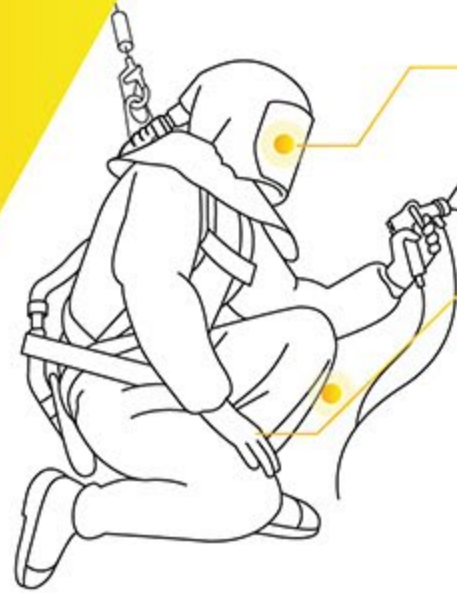
밀폐 공간 솔루션