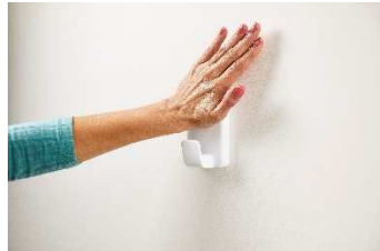
<取り付けイメージ>