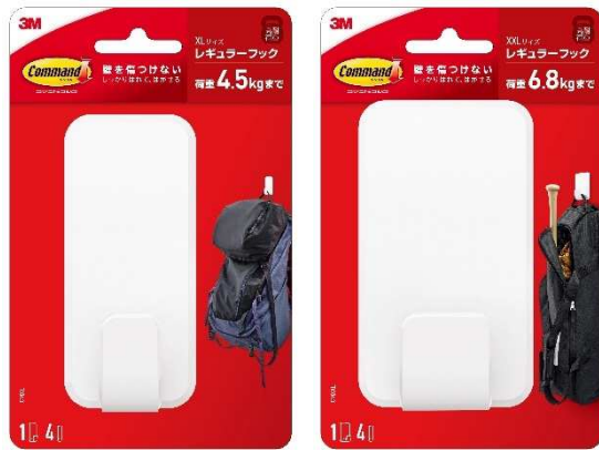
コマンド™ フック XL サイズ／XXL サイズ

スリーエム ジャパン株式会社（本社：東京都品川区 代表取締役：宮崎 裕子）は10月14日、コマンド™ フックシリーズ史上最大の耐荷重製品「コマンド™ フック XL サイズ／XXL サイズ」を発売します。