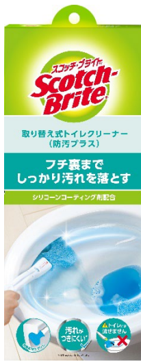
スコッチ・ブライツ™ 取り替え式トイレクリーナー (防汚プラス)

スリーエム ジャパン株式会社（本社：東京都品川区 代表取締役：宮崎 裕子）は、ご家庭のトータルクリーニングブランドであるスコッチ・ブライツ™ ブランドから、「スコッチ・ブライツ™ 取り替え式トイレクリーナー」の新シリーズとして「スコッチ・ブライツ™ 取り替え式トイレクリーナー（防汚プラス）」、「スコッチ・ブライツ™ 取り替え式トイレクリーナー（重曹プラス）」を9月14日より発売します。