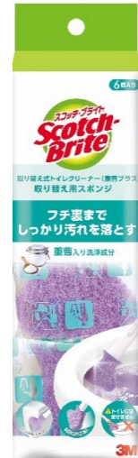
スコッチ・ブライツ™ 取り替え式トイレクリーナー (重曹プラス) 取り替え用スポンジ