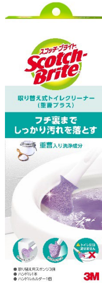
スコッチ・ブライツ™ 取り替え式トイレクリーナー (重曹プラス)