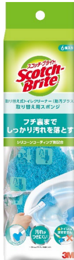
スコッチ・ブライツ™ 取り替え式トイレクリーナー (防汚プラス) 取り替え用スポンジ