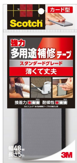
スコッチ® 強力多用途補修テープ スタンダードグレード カード型