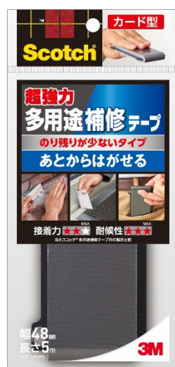
スコッチ® 超強力多用途補修テープ のり残りが少ないタイプ カード型