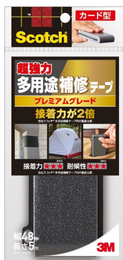
スコッチ® 超強力多用途補修テープ プレミアムグレード カード型