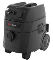
3M Xtract™ Taşınabilir Vakum Ünitesi