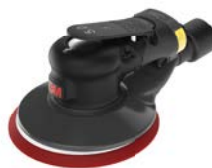
3M Xtract™ levigatrice rotorbitale pneumatica

Per la carteggiatura di legno, metallo e compositi, i dischi con supporto in rete 3M Xtract™ offrono una velocità di taglio leader del settore, aiutando a mantenere un ambiente di lavoro più pulito, con prestazioni migliori e risultati superiori. Disponibili anche in formato fogli in rotolo: 3M™ Cubitron™ II Net Fogli abrasivi con supporto in rete, in rotoli.