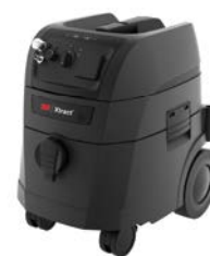
3M Xtract™ Aspiratore di polvere portatile