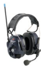
Nauszniki 3M™ PELTOR™ WS™ LiteCom Plus