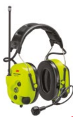
Nauszniki 3M™ PELTOR™ LiteCom Plus