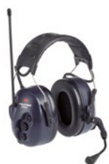
Nauszniki 3M™ PELTOR™ LiteCom