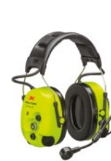
Nauszniki 3M™ PELTOR™ WS™ ProTac XPI