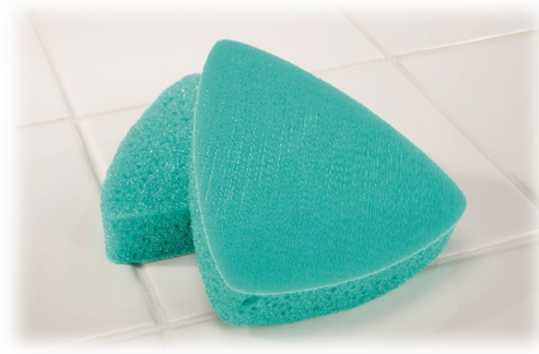
スコッチ・ブライツ™ バスシャイン™ SWIFT SCRUB バス用パワフルパッド

いざしっかり掃除をしようと思うと洗剤や掃除用品、手袋を用意したりと、お手入れに時間がかかり、負担が重いと思われるお風呂掃除。そんなお風呂掃除の作業量や頻度を軽減するアイテムとして発売するのが「スコッチ・ブライツ™ バスシャイン™ SWIFT SCRUB バス用パワフルパッド」です。この製品を使えば、入浴中や入浴直後など汚れに気づいたときに、その都度手軽に水だけで浴室のあらゆる場所を掃除することができます。