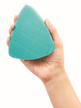
精密で細かなピラミッド形状の 高精細スクラブ面