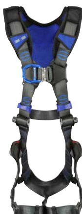
Ascension pour l'industrie générale*