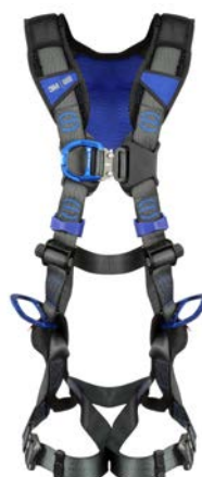
Ascension/positionnement (énergie éolienne)*