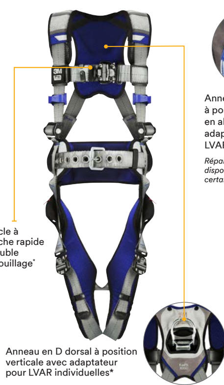
Harnais ExoFit MC DBI-SALA ® 3M MC de Série X200

Boucle à attache rapide à double verrouillage*