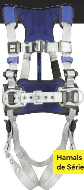
Harnais ExoFit MC de Série X100