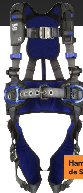
Harnais ExoFit MC de Série X300