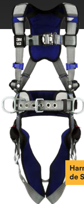
Harnais ExoFit MC de Série X200