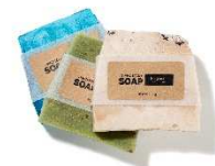
クラフト紙タイプ

レーザープリンタでの印刷適性に優れたラベルシールです。ラベル基材に耐水性があるため、冷蔵保存する製品におすすめです。