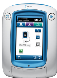
Unité de Thérapie 3M™ V.A.C.® Uitra

De quoi avez-vous besoin pour commencer la thérapie ?