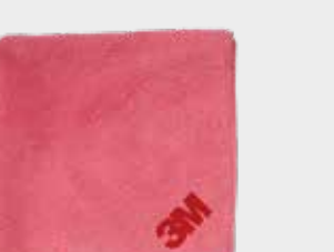
Высокоэффективная сверхмягкая микрофибровая розовая салфетка 3М™ Perfect-It™