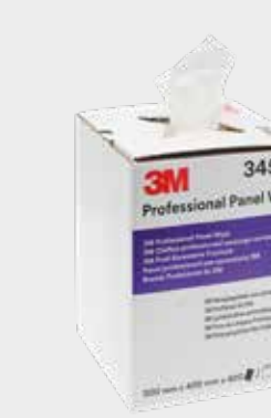
3М™ Профессиональные салфетки для панелей