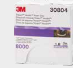
Абразивный полировальный круг 3М™ Trizact™ 8000