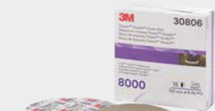
Абразивный полировальный круг 3М™ Trizact™ 8000