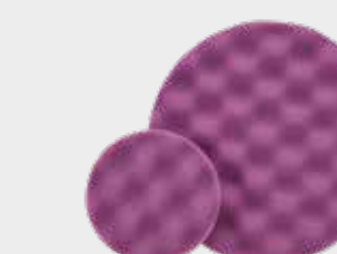
Фиолетовый рельефный полировальный круг 3М™ Perfect-It™ Hookit