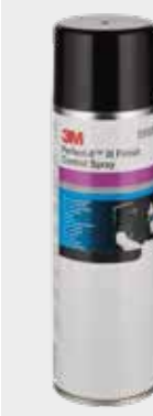
3М™ Perfect-It™ Тест-спрей