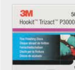
Абразивный полировальный круг 3М™ Trizact™ 3000