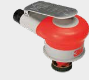
Орбитальная шлифовальная мини-машина 3М™, пневматическая