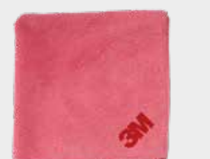
Высокоэффективная сверхмягкая микрофибровая розовая салфетка 3М™ Perfect-It™