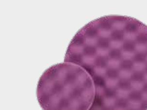
Фиолетовый рельефный полировальный круг 3М™ Perfect-It™ Hookit