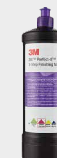
3М™ Perfect-It™ Одношаговая полировальная паста