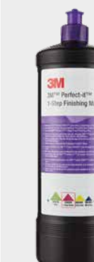
3М™ Perfect-It™ Одношаговая полировальная паста