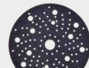
3М™ Hookit™ Подложка с мультислойной структурой