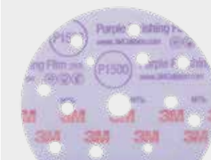
3М™ Hookit™ 260L+