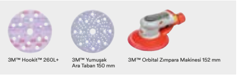
3M™ Hookit™ 260L+