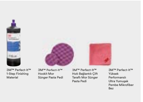
3M™ Perfect-It™ 1-Step Finishing Material