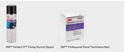
3M™ Perfect-It™ Finisaj Kontrol Spreyi

Not: Bu uygulamada zımparalama sırasında oluşan tüm çizikleri temizlediğimizi kontrol etmemiz, cila uygulamasının sonunda tekrar görünür olmalarını önlemek için çok önemlidir.