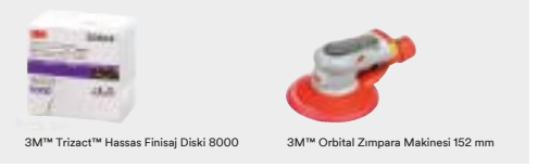
3M™ Trizact™ Hassas Finisaj Diski 8000