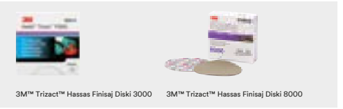
3M™ Trizact™ Hassas Finisaj Diski 3000