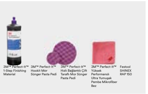
3M™ Perfect-It™ 1-Step Finishing Material

Not: Yüzeydeki boya&vernik yumuşaksa (taze ise), pasta makinesi devri düşük tutulup yüzey çok fazla ısıtılmadan uygulama yapılmalıdır.