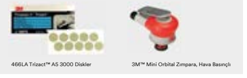
466LA Trizact™ A5 3000 Diskler