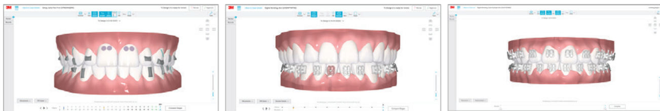
Le Portail Soins Oral 3M MC vous permet de planifier un traitement avec différents appareils.

Maintenant, vous pouvez visualiser plutôt que de deviner. Lorsque vous faites de la planification numérique avec des aligneurs, vous pouvez optimiser les outils de planification de traitement avancés du portail en utilisant le nouveau matériau d'alignement exclusif de 3M, les Aligneurs Flex Clarity MC 3M MC , en combinaison avec notre matériau éprouvé des Aligneurs Force Clarity MC 3M MC – ce qui vous donne encore plus de façons d'adapter votre approche thérapeutique selon vos besoins.