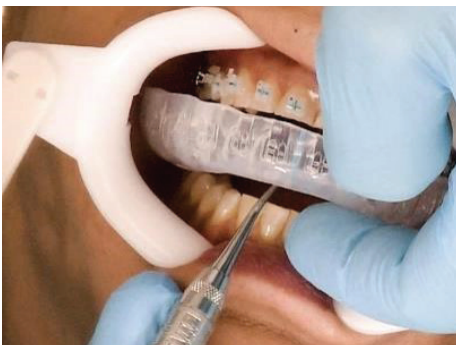
La planification numérique des traitements avec boîtiers et avec aligneurs est possible dans le Portail Soins Oraux 3M MC .

Le Portail Soins Oraux 3M MC respecte votre approche en matière de planification de traitement tout en vous donnant la possibilité de choisir des aligneurs, des boîtiers ou un traitement combiné. Et vous pouvez gérer l'occlusion dans le Tx Designer 3M MC pour ces modalités. En tant que spécialiste clinique de 3M, je vois souvent des médecins hésiter à essayer quelque chose de nouveau, même s'ils ont instinctivement l'impression que l'approche pourrait être plus efficace. Qu'arriverait-il si on utilisait, par exemple, des aligneurs sur l'arcade supérieure et des boîtiers sur l'arcade inférieure?