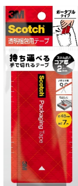
スコッチ® 透明梱包用テープ ポータブル

スリーエム ジャパン株式会社（本社：東京都品川区 代表取締役社長：宮崎裕子）が展開するスコッチ® ブランドより2021年7月15日、「スコッチ® 透明梱包用テープ ポータブル」を発売します。