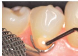
Colocación del fluido