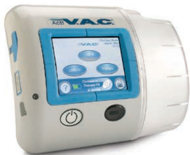
ACTIV.A.C.®型 陰圧維持管理装置 (ACTIV.A.C.®キャニスター装着時)

重量……………1.08Kg (空のACTIV.A.C.®キャニスターを含む) 寸法……………約19.3(横)×15.2(高さ)×6.8cm(奥行) 電池……………リチウムイオン充電電池 電池持続時間……約6時間フル充電後 約14時間使用可能 キャニスター ……300mL 治療モード……連続モード/間欠モード 吸引度……………高/中/低 陰圧設定範囲 ……陰圧 25~200mmHg (3.3~26.6kPa) キャリーケース……ナイロン製(黒) 本体を入れたままで画面操作、 バッテリー充電、チューブ格納ができるよう デザインされています。ケースには調整可能な ストラップが付属しています。