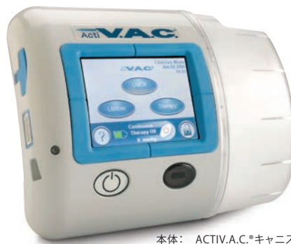
本体：ACTIV.A.C.®キャニスター装着時