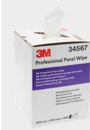
3M™ Professional Panel Wipes