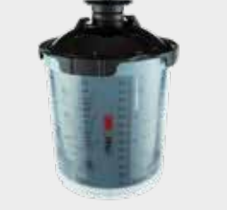
3M™ PPS™ serie 2.0 UV-sett