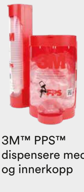
3M™ PPS™ dispensere med lokk og innerkopp