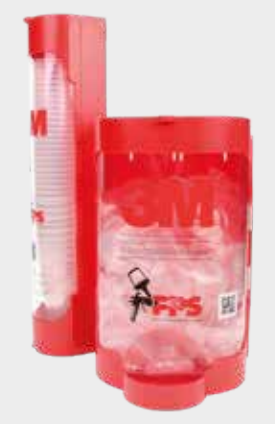
3M™ PPS™ dispensere med lokk og innerkopp