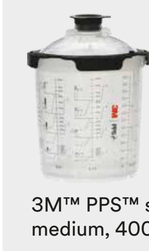
3M™ PPS™ serie 2.0 medium, 400 ml