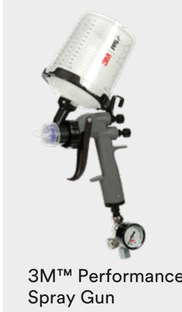
3M™ Performance Spray Gun