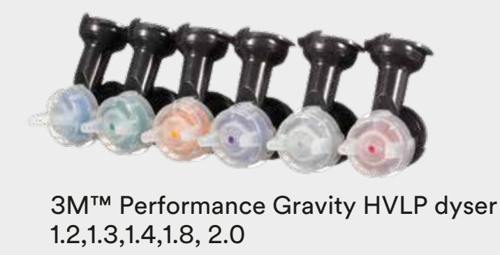
3M™ Performance Gravity HVLP dyser 1,2,1,3,1,4,1,8, 2,0