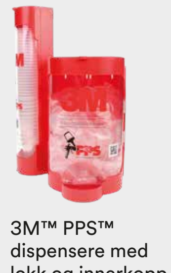
3M™ PPS™ dispensere med lokk og innerkopp