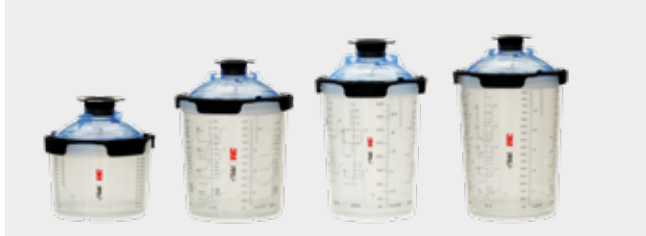
3M™ PPS™ serie 2.0 Spraykoppssystem, stort 850 ml, standard 650 ml, medium 400 ml, mini 200 ml