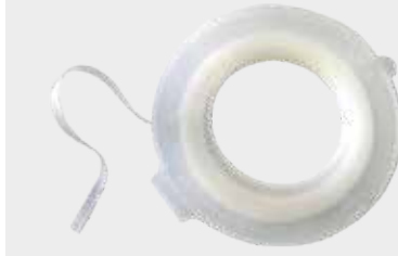
3M™ Glatt Overgangstape