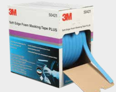
3M™ Maskeringstape i skum med myk kant PLUS