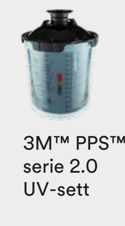
3M™ PPS™ serie 2.0 UV-sett