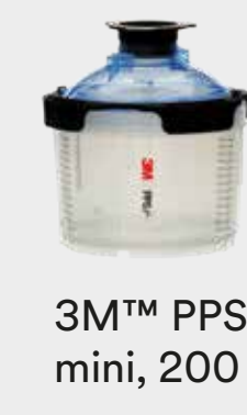
3M™ PPS™ serie 2.0 mini, 200 ml