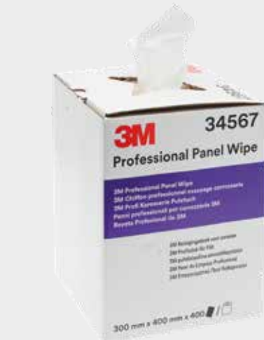
3M™ Professional Panel Wipes